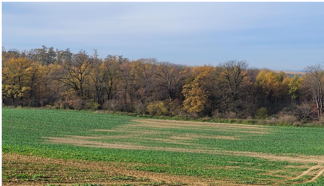
ZDJĘCIE NR 1

Wielogatunkowy kompleks leśny odizolowany polami uprawnymi jest cechą charakterystyczną jednostki