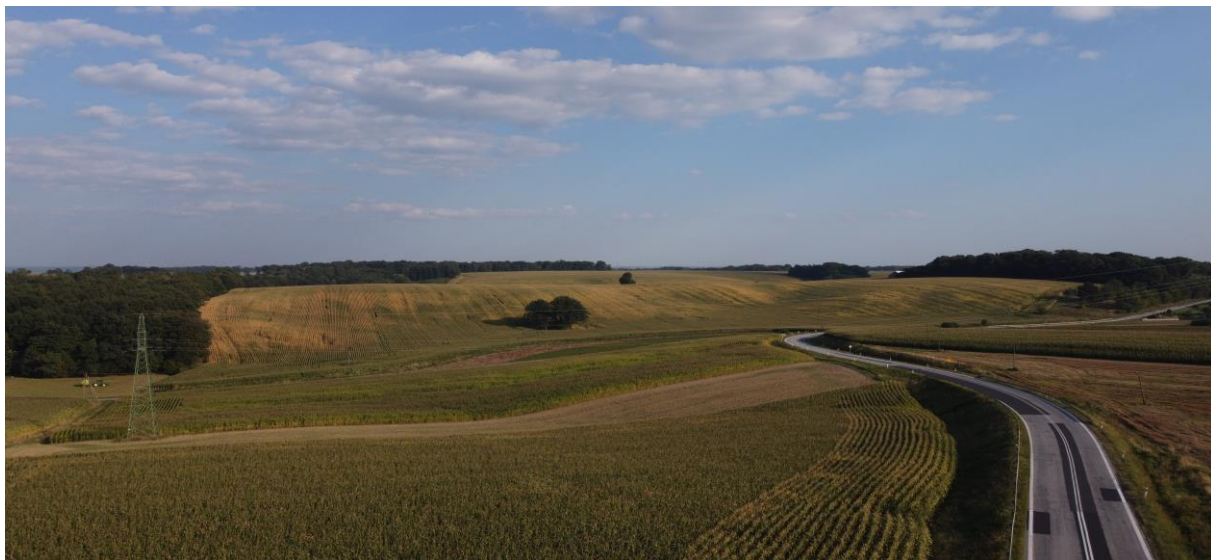
Widok na krajobraz lasowy znad sąsiedniej jednostki, widok znad drogi nr. 49