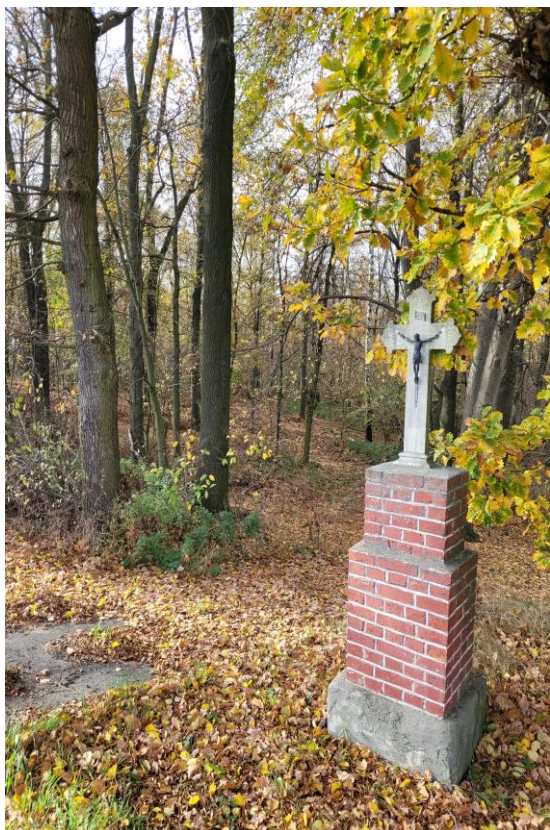
ZDJĘCIE NR 2

Krzyż przydrożny na skraju lasu