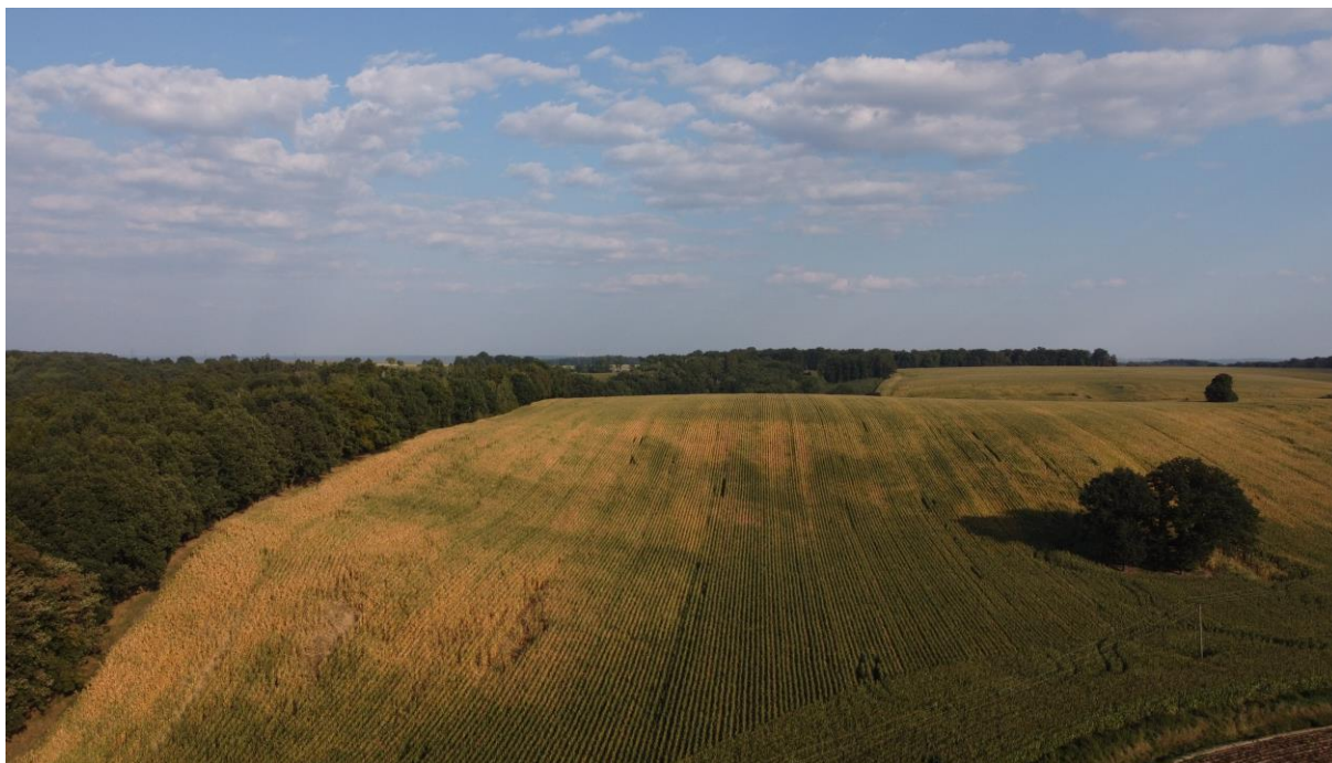
Krajobraz pagórkowaty, ostra granica krajobrazu lasowego i wiejskiego